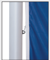
Mittlere Karabiner in die Ösen der Fahnentuchhalter einhaken.