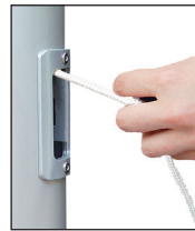
Hissen der Fahne durch horizontales Ziehen, Einholen durch Loslassen.

Die klassische Innenseilführung mit dem im Mastrohr laufenden PES-Hissseil. Die Handhabung des Hissseiles erfolgt über das Bediengehäuse mit (SchnellFixierSystem) alfa-SFS mit sperrbarem Türchen. Hissen und Abnehmen der Fahnen erfolgt durch Ziehen bzw. Nachlassen des Hissseiles. Bei Loslassen arretiert das Hissseil selbsttätig in der Spezial-Seilklemme im SFS-Gehäuse.