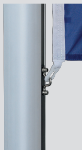
Zubehör: Fahnenstraffer, unverlierbar

5 Jahre Garantie auf Standicherheit der Mastrohre