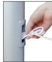
Nach dem Hissen Seil in Schlaufen legen und als Bund in das Bediengehäuse stecken.