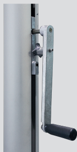
Kurbelhissvorrichtung alfa FlagLift® , Handkurbel