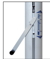
Kompaktantrieb, Handkurbel mit Entsperrstift