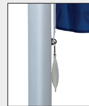
Untere Karabiner – zusammen mit Fahnenstraffergewicht in Öse des untersten Fahnentuchhalters einhaken.