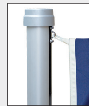
Obere Fahnenkarabiner in Öse des Zugschlittens einhaken.

Es können alle gängigen, frei auswehenden Fahnen gehisst werden. Die maximal zulässigen Fahnenengößen sind unter den technischen Daten aufgeführt. Abgespannte Bannerfahnen sind grundsätzlich ab 7 Beaufort (50 – 61 km/h) Wind abzunehmen.