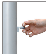
Entsperrstift ziehen, Riegel nach unten schieben: ENTSICHERN

Das patentierte Kurbel-Hissystem alfa FlagLift® besteht aus dem Kompaktantrieb mit VA-Antriebsrad, dem VA-Hissseil und dem Langschlitten mit Federvorspannung. Alle Bauteile befinden sich in der Mastnut. Die Seilarretierung wird durch eine Federbremse bewirkt, die durch einfaches Anheben des Sicherungsriegels das Antriebsrad blockiert und den Steckerzug für die Handkurbel verschließt. Die Entriegelung erfolgt mittels eines Spezial-Entsperrstiftes in einem Handgriff.